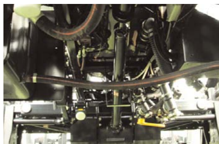
Механический привод MaxTorque®

Инженерам-конструкторам компании была поставлена задача создать самый мощный и эффективный самоходный опрыскиватель, который будет по карману. Результатом стала машина 7830, которая дает вам в распоряжение непревзойденные возможности.