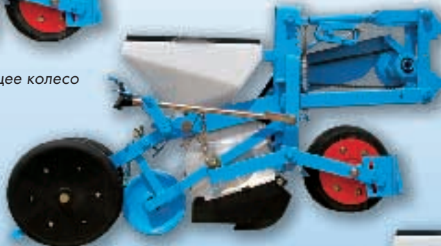
MECA V4 Балансировочный механизм