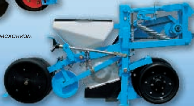
MECA V4 Двойные диски