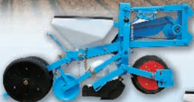
MECA V4 Переднее копирующее колесо (Стандарт)

Выбор между тремя типами высеивающих секций